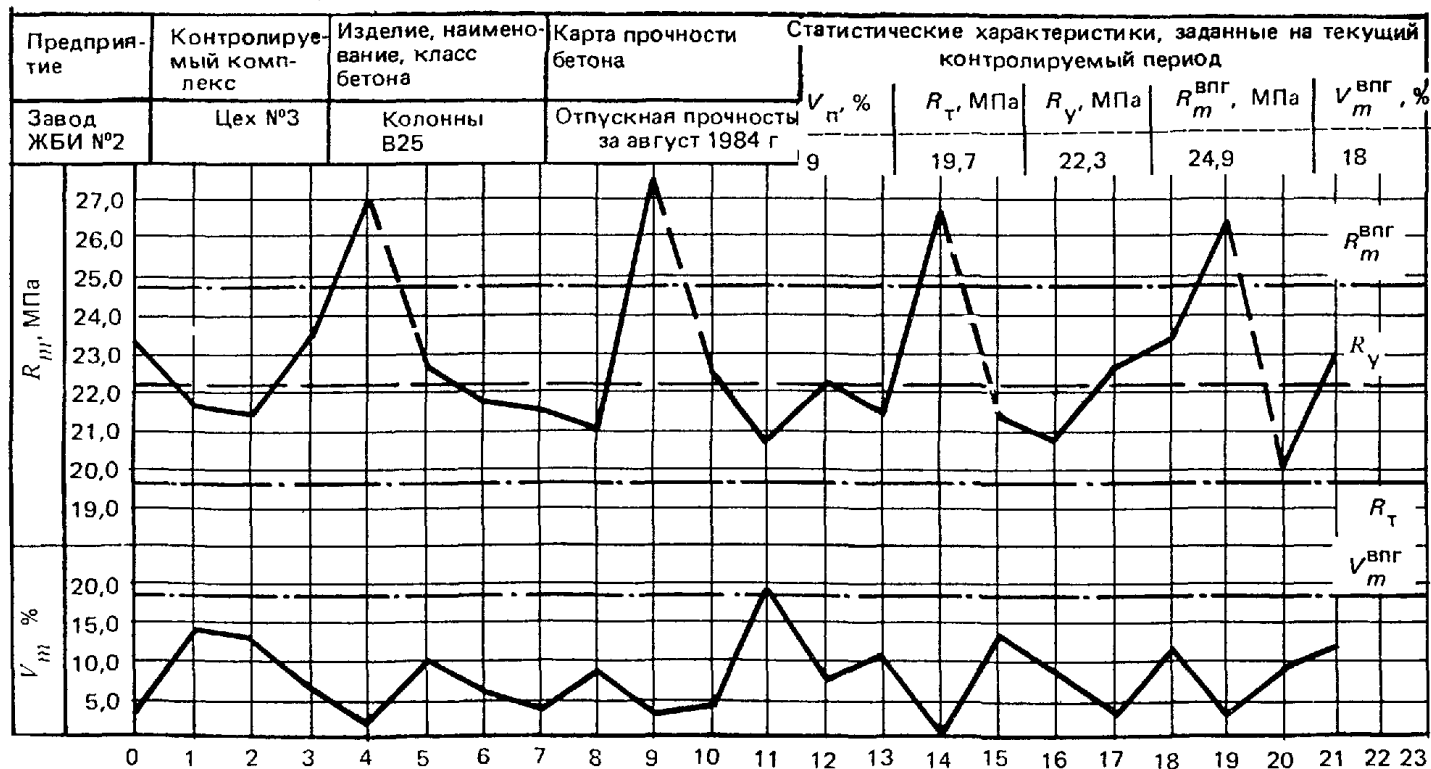
Контрольная карта примера корректировки прочности бетона перед выходными днями