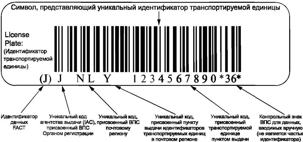
Рисунок В.2 — Пример представления уникальной идентификации транспортируемых единиц в символическом штриховом коде Code 128 (Код 128)

В.2 Пример представления уникальной идентификации транспортируемых единиц в символическом штриховом коде Code 128 (Код 128)** с идентификатором данных FACT (ФАКТ)*** «J» и визуальным представлением приведен на рисунке В.2.