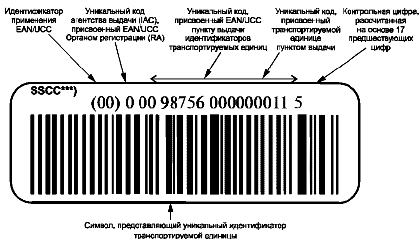
Рисунок В.1 — Пример представления уникальной идентификации транспортируемых единиц в символике штрихового кода EAN/UCC 128 с идентификатором применения EAN/UCC «00» и визуальным представлением знаков

В.1 Пример представления уникальной идентификации транспортируемых единиц в символике штрихового кода EAN/UCC 128* с идентификатором применения EAN/UCC** «00» и визуальным представлением знаков приведен на рисунке В.1.