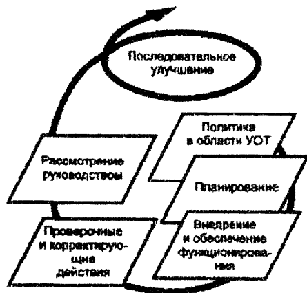
Рисунок - Модель системы управления охраной труда (СУОТ)

Методология создания и функционирования систем управления (менеджмента) по ряду направлений определяется общепризнанными международными стандартами ИСО серии 9000 (управление качеством) и ИСО серии 14000 (управление охраной окружающей среды). В основе методологии создания и функционирования систем управления, определяемой этими международными стандартами, положены известные принципы: "планируй - выполняй - контролируй - совершенствуй", реализуемые в рамках политики в рассматриваемом направлении деятельности. Модель такого подхода приведена на рисунке.