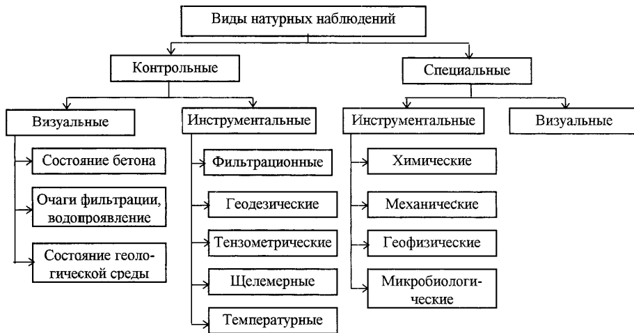
Схема 1. Виды натурных наблюдений на бетонных плотинах