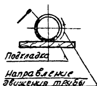
Схема наложения слоев шва поворотного стыка.