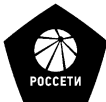
Рисунок Р.1 – Изображение фирменного знака качества ПАО «Россети»