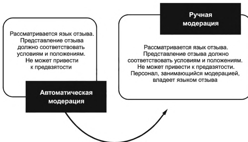
Рисунок 2 — Процесс модерации