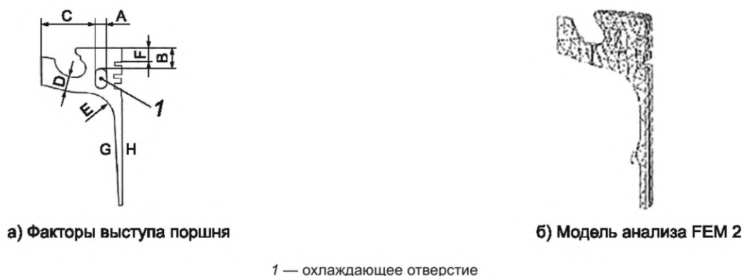
Рисунок 3 — Целевая продукция: выступ поршня

Факторы, приведенные в таблице 13, являются контрольными факторами RPD. Эксперимент RPD определил оптимальное условие RPD как комбинацию оптимальных уровней факторов с точки зрения робастности и установил значения оптимальных уровней для номинальных значений. Факторы А—D представляют собой габаритные конструктивные параметры, как показано на рисунке 3а), а факторы G и H — температуры выступа поршня, устанавливаемые управляющим устройством в двигателе. Охлаждающее масло проходит через охлаждающее отверстие и регулирует температуру выступа поршня. Температуру выступа поршня рассчитывают с использованием программного обеспечения CAE (автоматизированное проектирование) для анализа тепла FEM (методом конечных элементов) модели, изображенной на рисунке 3б).