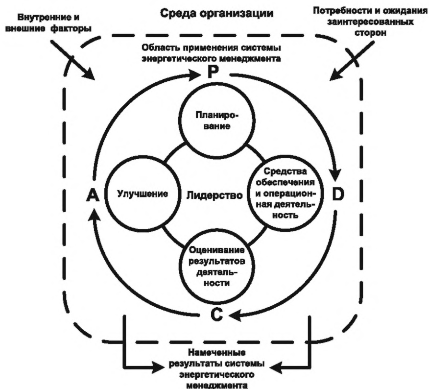
Рисунок 1 — Цикл «планируй — делай — проверяй — действуй»

- действуй (act): предпримите действия в отношении несоответствий и постоянно улучшайте энергетические результаты деятельности и систему энергетического менеджмента.