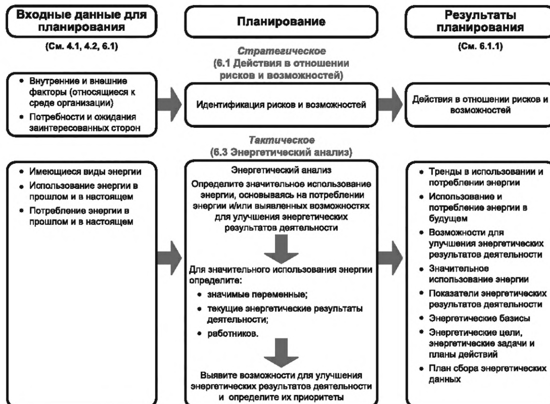
Рисунок А.2 — Процесс энергетического планирования

Принципиальная схема, предназначенная для улучшения понимания процесса энергетического планирования, показана на рисунке А.2. Рисунок А.2 не показывает подробности конкретной организации. Информация, представленная на рисунке А.2, носит пояснительный характер и не является исчерпывающей. Для данной организации или конкретных обстоятельств могут существовать другие специфичные подробности.