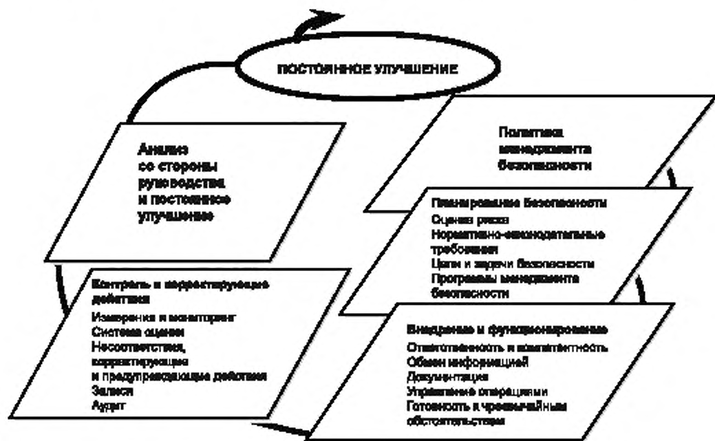
Рисунок 2 — Элементы системы менеджмента безопасности