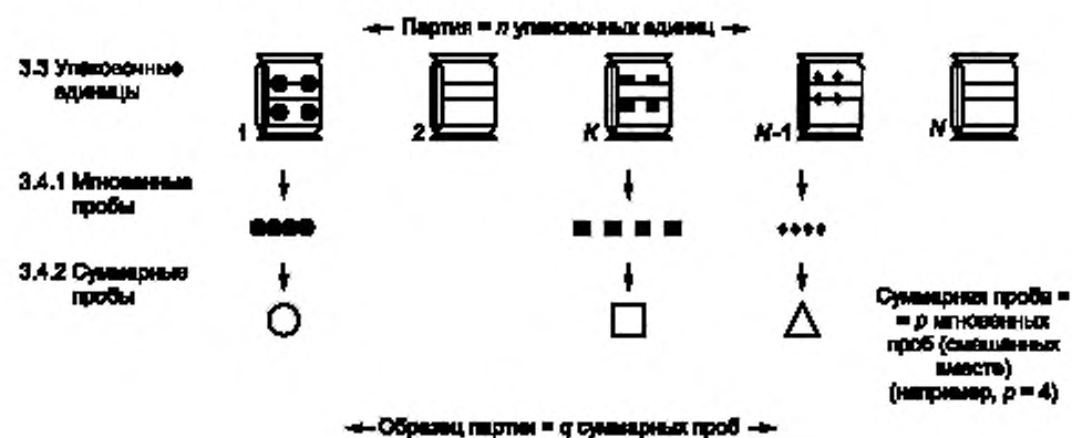
Рисунок 1 — Схема отбора проб. Этап 1