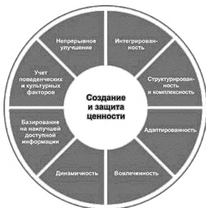
Рисунок 2 — Принципы

Принципы, представленные на рисунке 2, устанавливают характеристики эффективного и результативного менеджмента риска, отражают его ценности и объясняют его назначение и цель. Эти принципы являются основой менеджмента риска и должны учитываться при создании структуры и процесса менеджмента риска организации. Соблюдение принципов позволит организации управлять влиянием неопределенности в отношении достижения целей организации.