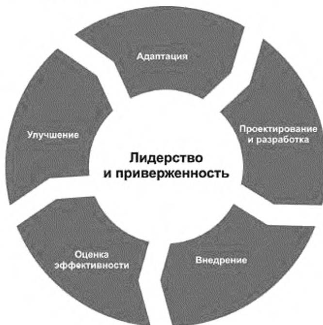
Рисунок 3 — Структура

Внедрение структуры менеджмента риска включает в себя интеграцию, проектирование и разработку, внедрение, оценку и улучшение менеджмента риска в организации. На рисунке 3 представлены компоненты структуры.