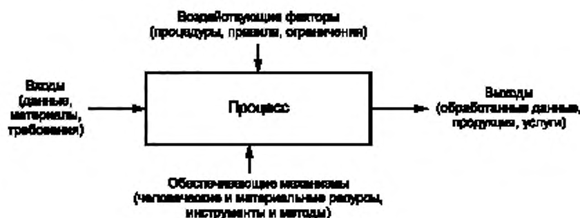
Рисунок 2 — Пример модели процесса

контроля и реализации цели. Процесс трансформирует или конвертирует первичные входы в желаемые выходы. Это преобразование зависит от условий, устанавливаемых соответствующими механизмами и влияющими факторами. Некоторые влияющие факторы являются контролируруемыми (например рабочие процедуры для активации процесса), другие могут быть неконтролируемыми (например погодные условия или неожиданные климатические изменения). Для осуществления преобразований необходимы механизмы в виде методов и инструментов. Ниже приведена модель процесса, используемая для описания технических процессов в настоящем стандарте.