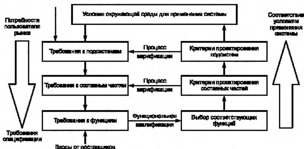
Рисунок С.1 — Процесс определения требований среды

На рисунке С.1 представлен общий вид процесса определения требований.