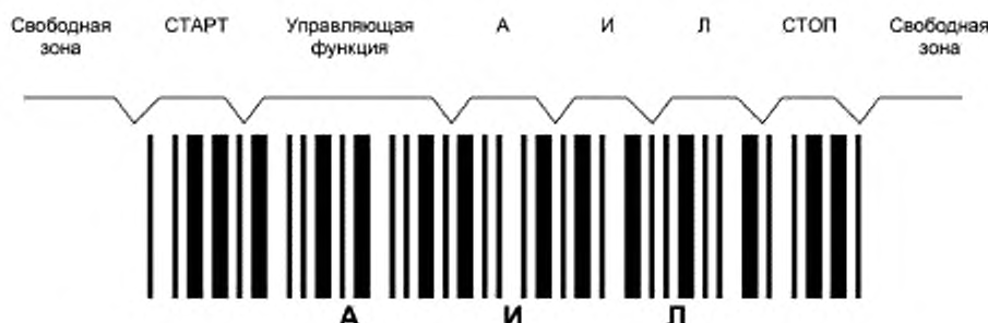
Рисунок ДА.1 — Символ штрихового кода, в котором закодированы знаки АИЛ

Служебные знаки «-», «.» при декодировании не передаются и в визуальном представлении не указываются. Символы штрихового кода, в котором закодированы знаки АИЛ, приведены на рисунке ДА.1.