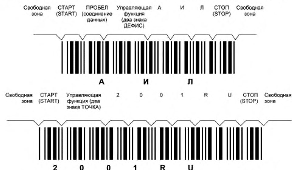
Рисунок ДА.2 — Символы штрихового кода, в которых закодированы данные АИЛ2001RU

Символы штрихового кода, в которых закодированы данные АИЛ2001RU, приведены на рисунке ДА.2.