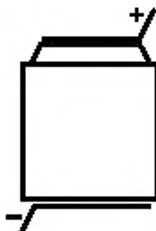
Рисунок 3 — Соединение крышка—дно корпуса KR...НВ