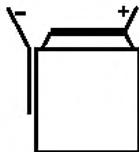
Рисунок 1 — Аккумуляторы без выводов KR...CF