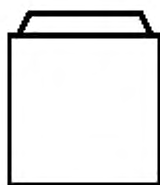
Рисунок 2 — Соединение крышка—крышка KR...НН