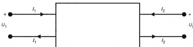
Рисунок 1 — Условные обозначения, используемые в электрических цепях

Для определения матричных элементов используются условные обозначения, показанные ниже на рисунке 1, соответствующие требованиям стандарта IEC 60375.