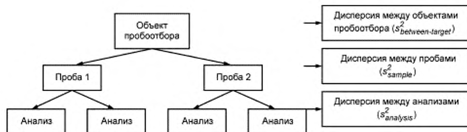
Рисунок 2 — Сбалансированный план пробоотбора

При этом может быть использован более высокий уровень повторения, но дублирование является наиболее эффективной формой при исследованиях в целях оценки неопределенности пробоотбора ЯМ.