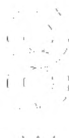
Положение шланга в начале и конце каждого изгиба Рисунок 104 — Положения изгиба для шланга после извлечения из морозильного шкафа