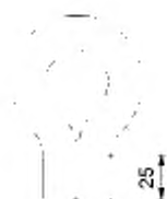
Рисунок 103 — Конфигурация шланга для его замораживания. Промежуточное положение