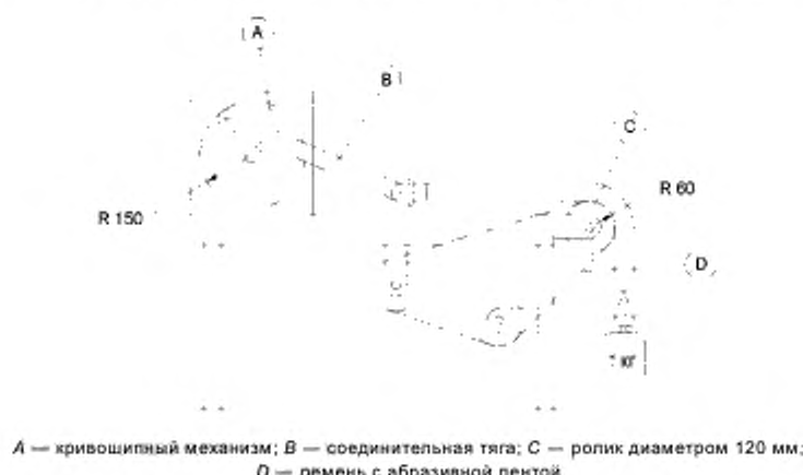
А — кривошипный механизм; В — соединительная тяга; С — ролик диаметром 120 мм; D — ремень с абразивной лентой

Один конец шланга прикрепляют к соединительному стержню кривошипного механизма, изображенного на рисунке 101. Кривошип вращается со скоростью 30 об/мин, в результате чего конец шланга перемещается в горизонтальной плоскости возвратно-поступательно на расстояние 300 мм.