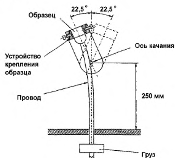
Рисунок 103 – Пример устройства для проведения испытаний на гибкость