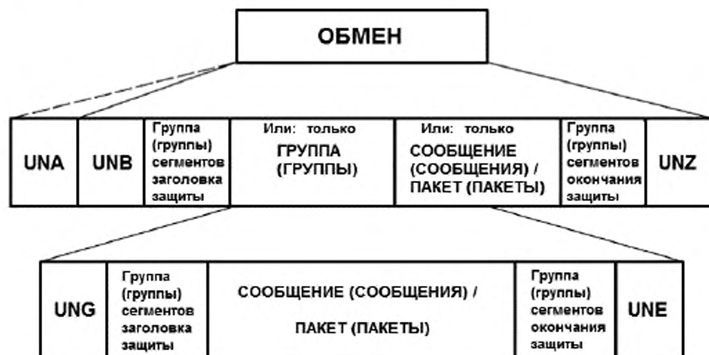
Рисунок 5 – Схематическое представление обмена, обеспечивающее защиту как на уровне обмена, так и на уровне групп