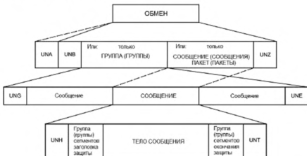
Рисунок 1 – Схематическое представление обмена, показывающее службу с защитой на уровне сообщений

На рисунке 2 приведено схематическое представление обмена, иллюстрирующее защиту на уровне пакетов.