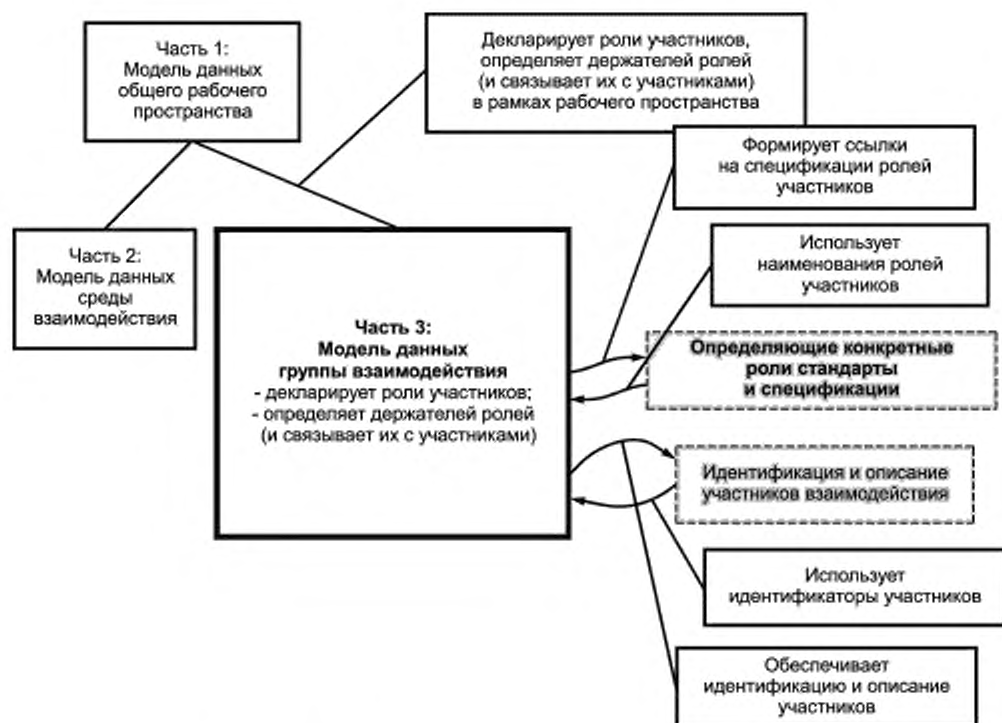
Рисунок 1 — Определение ролей, держателей ролей и назначение участников взаимодействия в настоящем стандарте