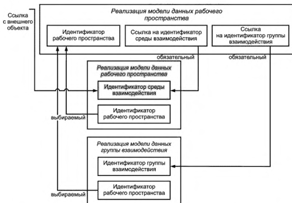
Рисунок 3 — Связи между средой взаимодействия, общим рабочим пространством и группой взаимодействия

Данная ссылка на идентификатор является дополнительной, так как в некоторых случаях эта ссылка может не потребоваться.