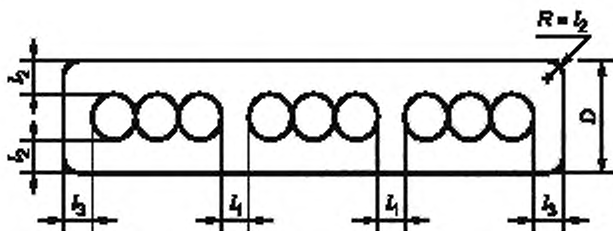
Рисунок 1 — Поперечное сечение кабеля (Рисунок приведен для иллюстрации толщины оболочки и значения просвета, приведенных в таблице 4, и не определяет действительную конструкцию.)

Среднее значение просвета l_1 не нормировано. При этом любое значение просвета между группами жил может быть менее номинального значения просвета l_1 не более чем на 0,2 мм плюс 20 % номинального значения просвета l_1 .