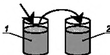
1 — стакан с пробой моторного топлива (промывка). 2 — стакан с пробой моторного топлива (измерение)

5.2.1 Измерительный датчик анализатора устанавливают поочередно в стаканы (рисунок 1), предварительно наполнив их измеряемой пробой.