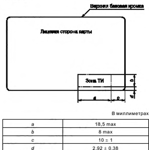
Рисунок 1 — Расположение зоны ТИ

П р и м е ч а н и е — Некоторые способы получения рельефного изображения могут разрушить компоненты карты, которые находятся в зоне ТИ.