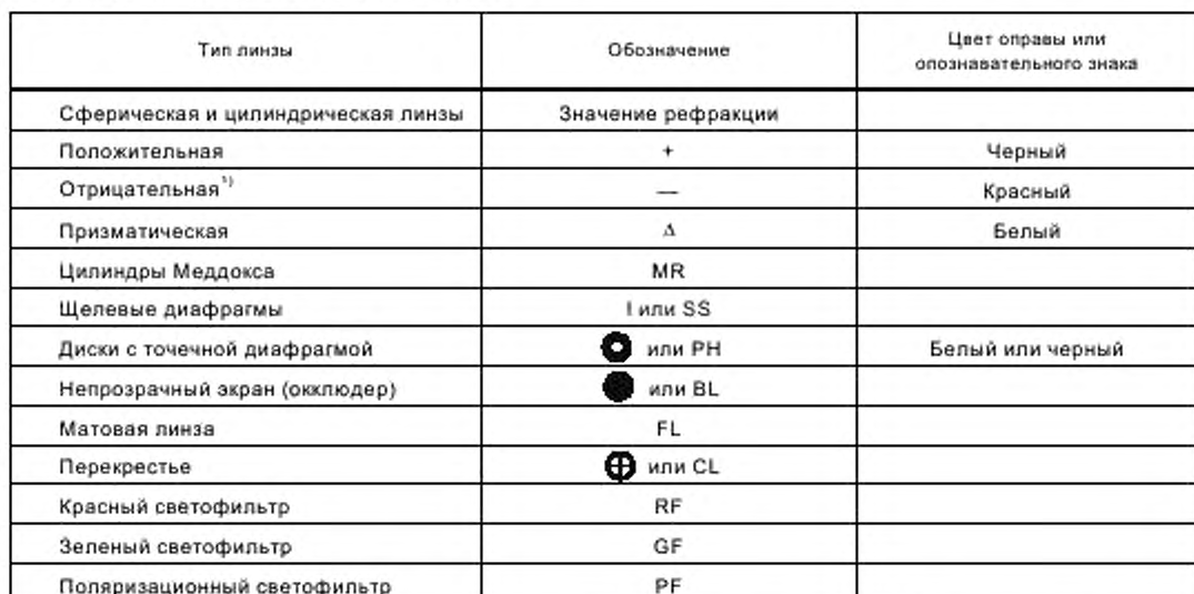
Таблица 7 — Опознавательные знаки линзы

1) В случае пересечения цилиндров оси отрицательного цилиндра должны быть маркированы красным цветом.