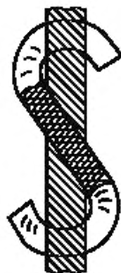
Рисунок 1 — S-крутка

П р и м е ч а н и е — Могут быть использованы строчные буквы s и z, если это определяется особыми условиями.